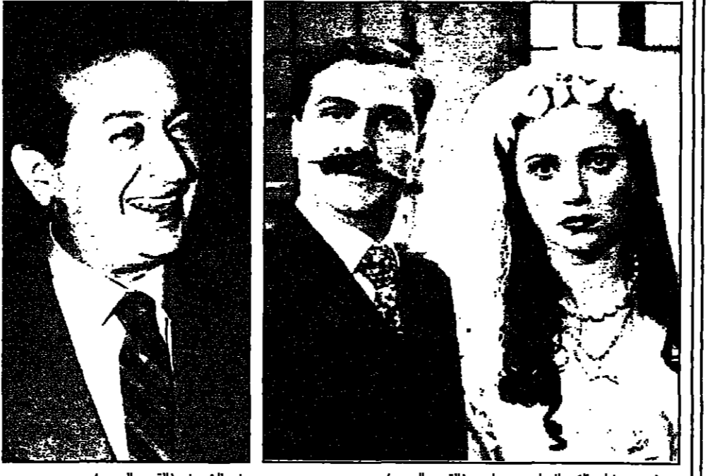
مشهد من فيلم «الترحال» لريمون بطرس (القدس العربي)

ستصدر 545 رواية وخمسمة وثلاثة بين الاول من ايلول (سبتمبر) وحتى 15 تشرين الثاني (اكتوبر)، وهي للكتابة التي تحدد اللوسم الثقافي الفرنسي الجديد التي عالية ما يبعثا بعد انتهاء عملة المصيف، وهذا العدد الاخير من الانتاج الذي تحظى عليه الرواية بامتياز بشكل زيادة على انتاج العام الماضي بنسبة 12 بالمائة.